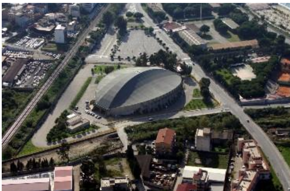
Palazzetto dello Sport "Francesco Calafiore" Parco Pentimele – 89211 Reggio Calabria

Piano operativo per lo svolgimento della prova scritta per l'assunzione, a tempo pieno e indeterminato, di complessivi n. 4 (quattro) posti di Operatore tecnico specializzato - Autista di ambulanza Cat BS